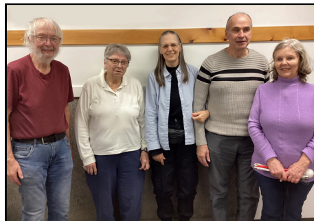
Le conseil d'administration